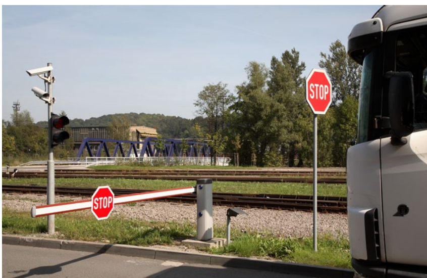
Vjezdový systém – Třinecké železářny