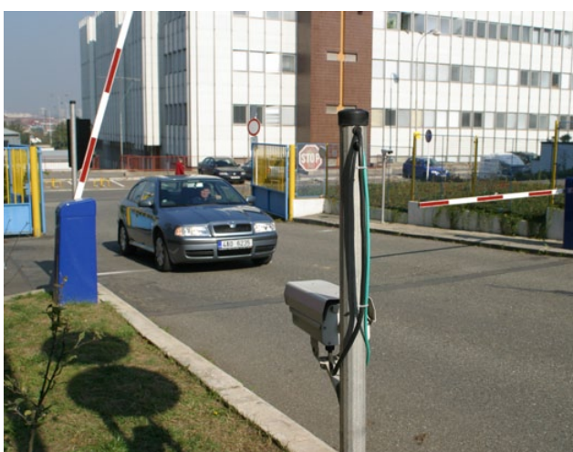
Vjezdový systém – sídlo společnosti AŽD Praha