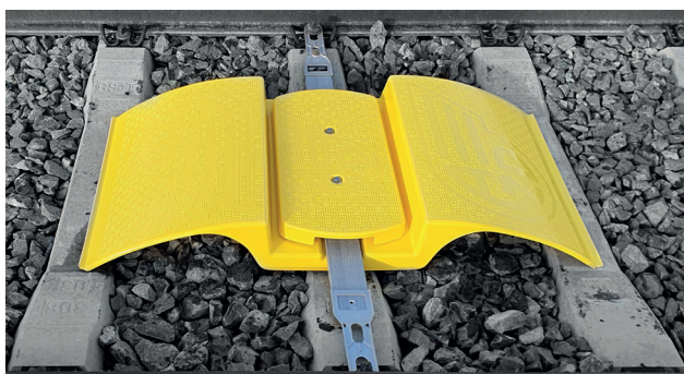
Pohled ze strany koleje