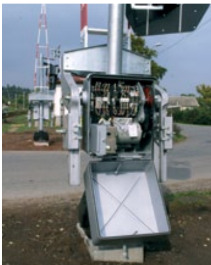
Шкаф привода шлагбаума 99

Шлагбаум AŽD 99 является составной частью оборудования для переездов, которая в результате опускания перекладины шлагбаума в месте продвижения транспортных средств на наземной коммуникации выдает механическое предупреждение участникам дорожного движения о приближающемся железнодорожном транспортном средстве.